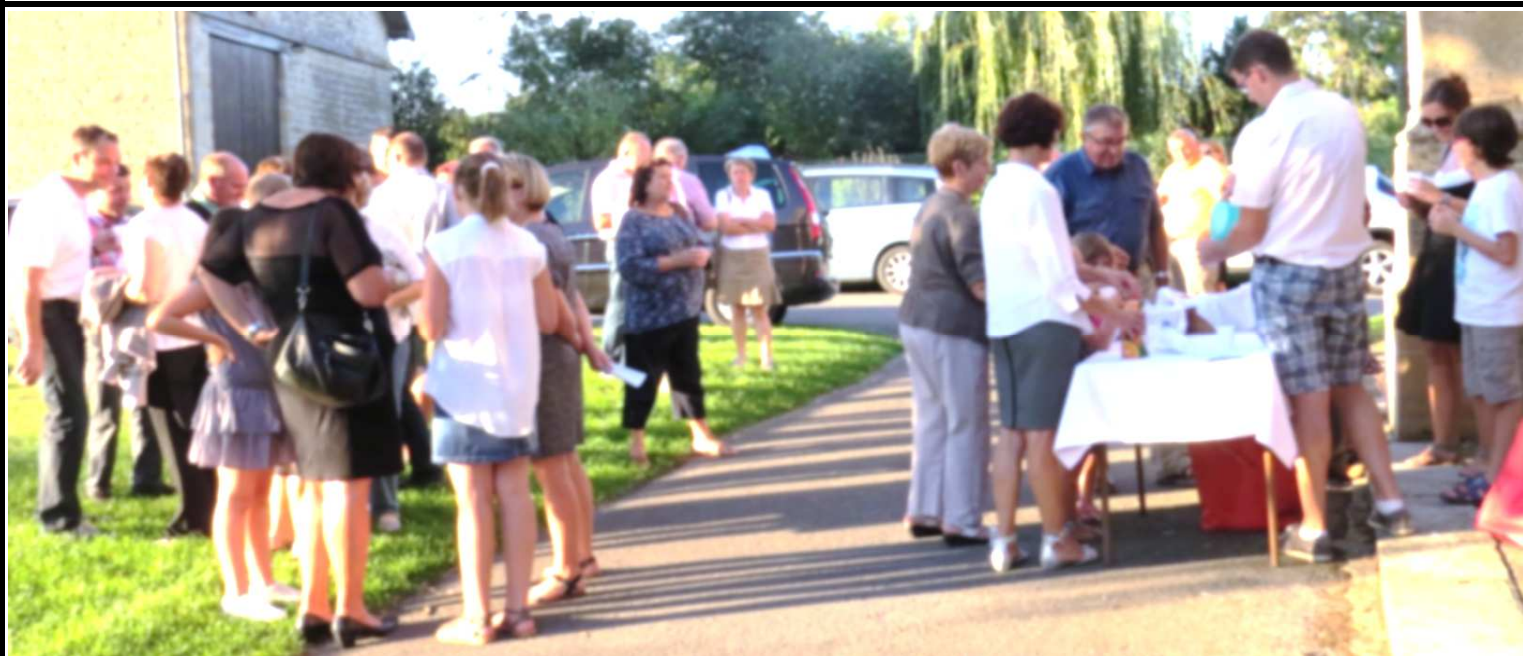
Fête de Charbogne : collation après la célébration à l'Eglise