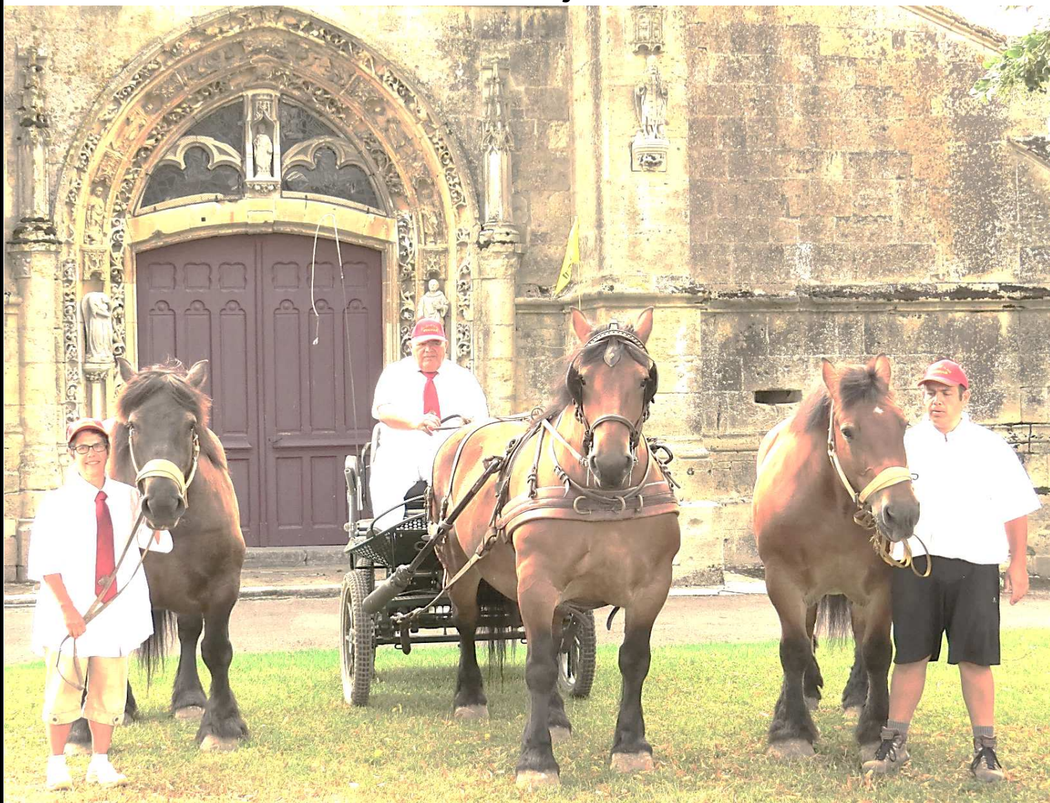
Violette de Charbogne (2009) bai brun foncé 920 kg - Quille de la forge (2004) bai 900 kg - Kaola 7 (1998) bai 780 kg