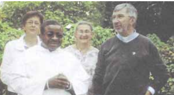
Paroisse Saint-Méen d'Attigny