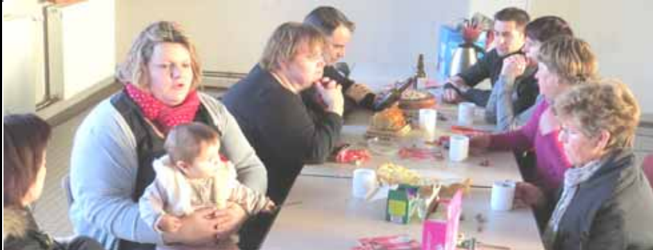
suivie d'une boisson chaude