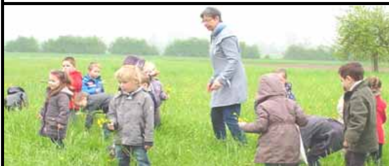
Découverte et cueillette de printemps des fleurs des champs le 3 mai

Le budget d'entretien des espaces verts est de 7500€. Les coûts pourraient être réduits si chacun nettoyait devant son habitation (curage rigole - traitement mauvaises herbes...)