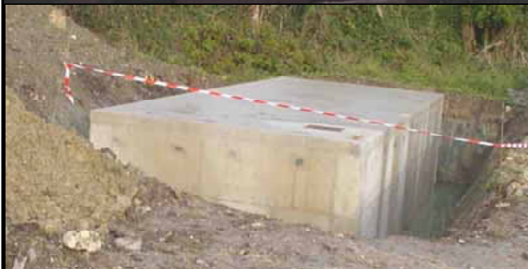
Une nouvelle réserve d'eau d'incendie 120m3 a été implantée rue d'Alland'Huy