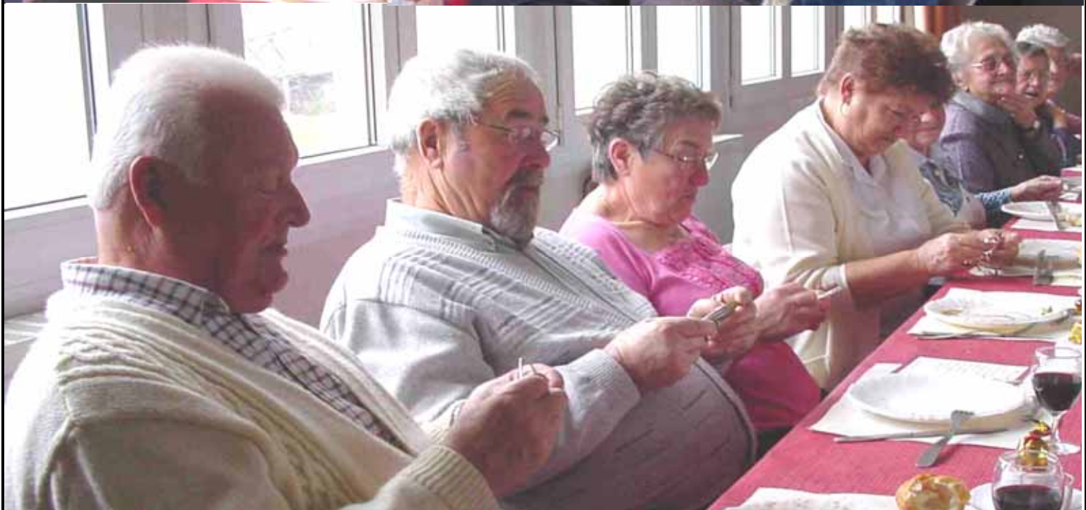
Casse-têtes sur un air d'accordéon pour le repas des anciens le 29/11/2008