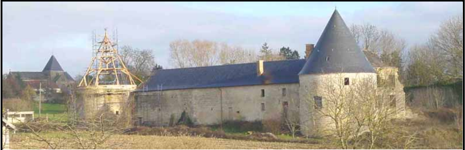
La nouvelle charpente de la tour nord-est du Château est en place