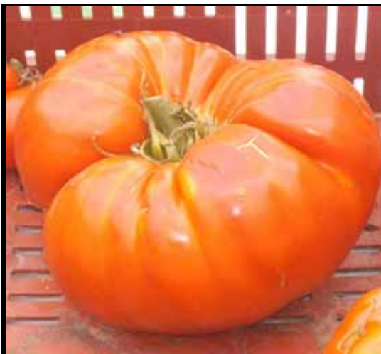
Une tomate de 1kg740 récoltée cet été par Stéphane Petit dit Duhal