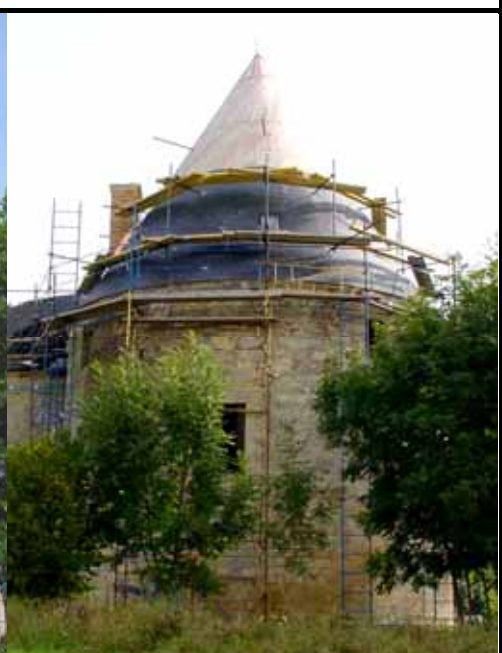
La toiture de la tour sud-ouest du château se termine