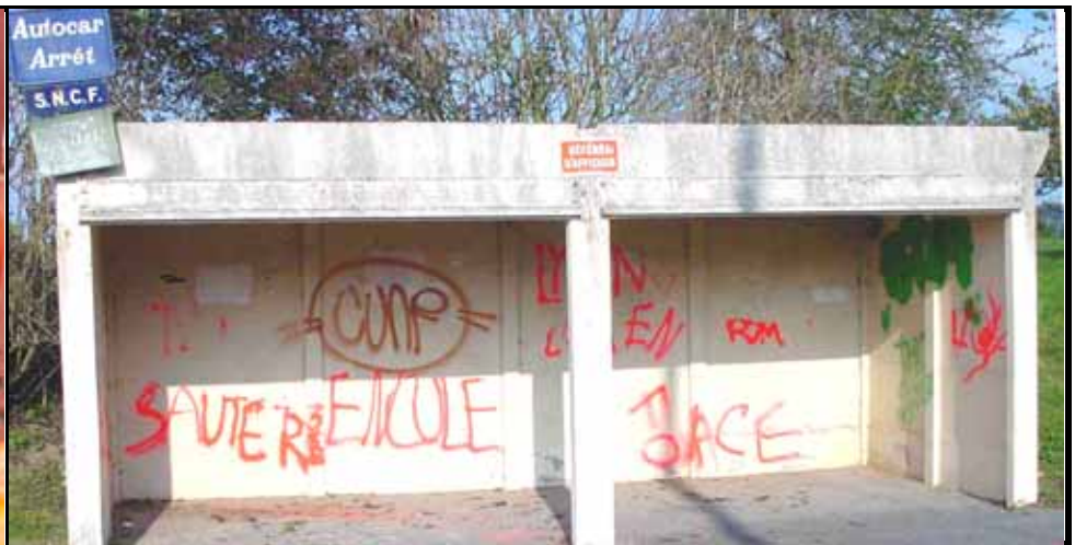
Le panneau défense d'afficher n'est plus d'actualité, les tags ayant remplacé les affiches - Et maintenant ?