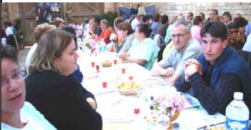
Repas entre Charbogniens avant le spectacle " Les Misérables "