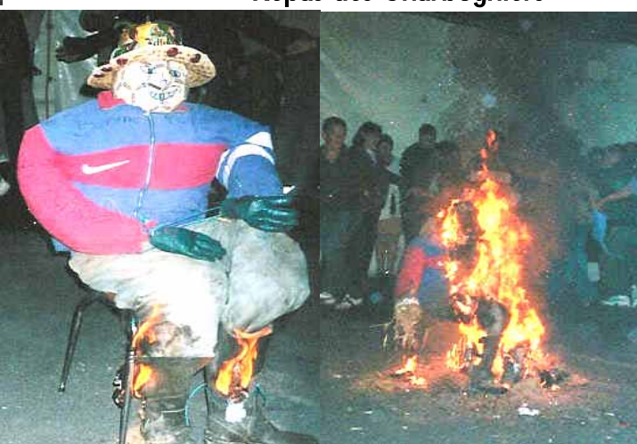
Incineration de Charbognus avant et pendant