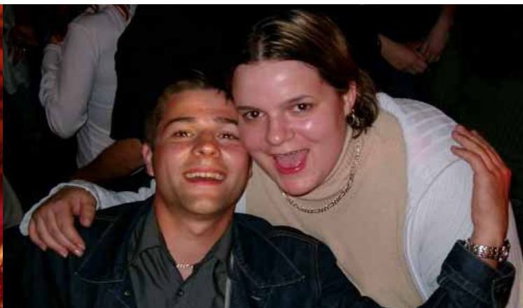
Bal avec l'orchestre Equation