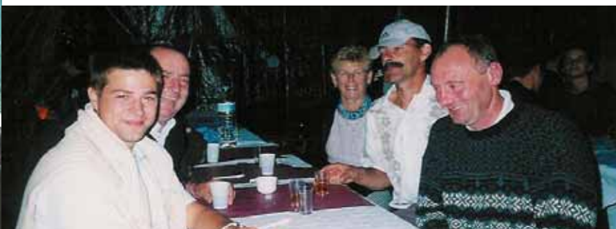
Repas des Charbogniers