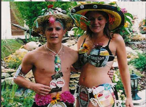
Concours chapeaux fleuris avant la pluie