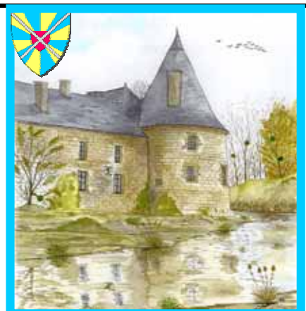
Château - XVIe