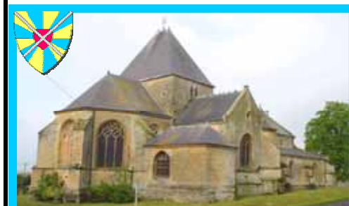
2 (2) Eglise - XVIe