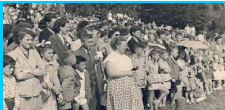
Fête des Moissons 1954