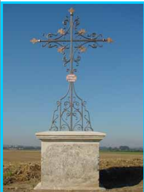
Croix Cyrille Louis 1910 Route de Saint Lambert Rénovation Août 2003