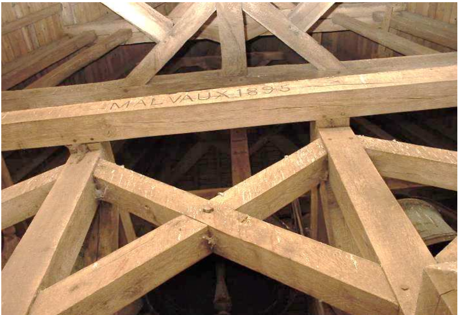
2 nouvelles cloches 964kg et 460kg en 1895 - Auguste Malvaux né en 1840 charpentier et Louis Malvaux né en 1863 charpentier MALVAUX 1895