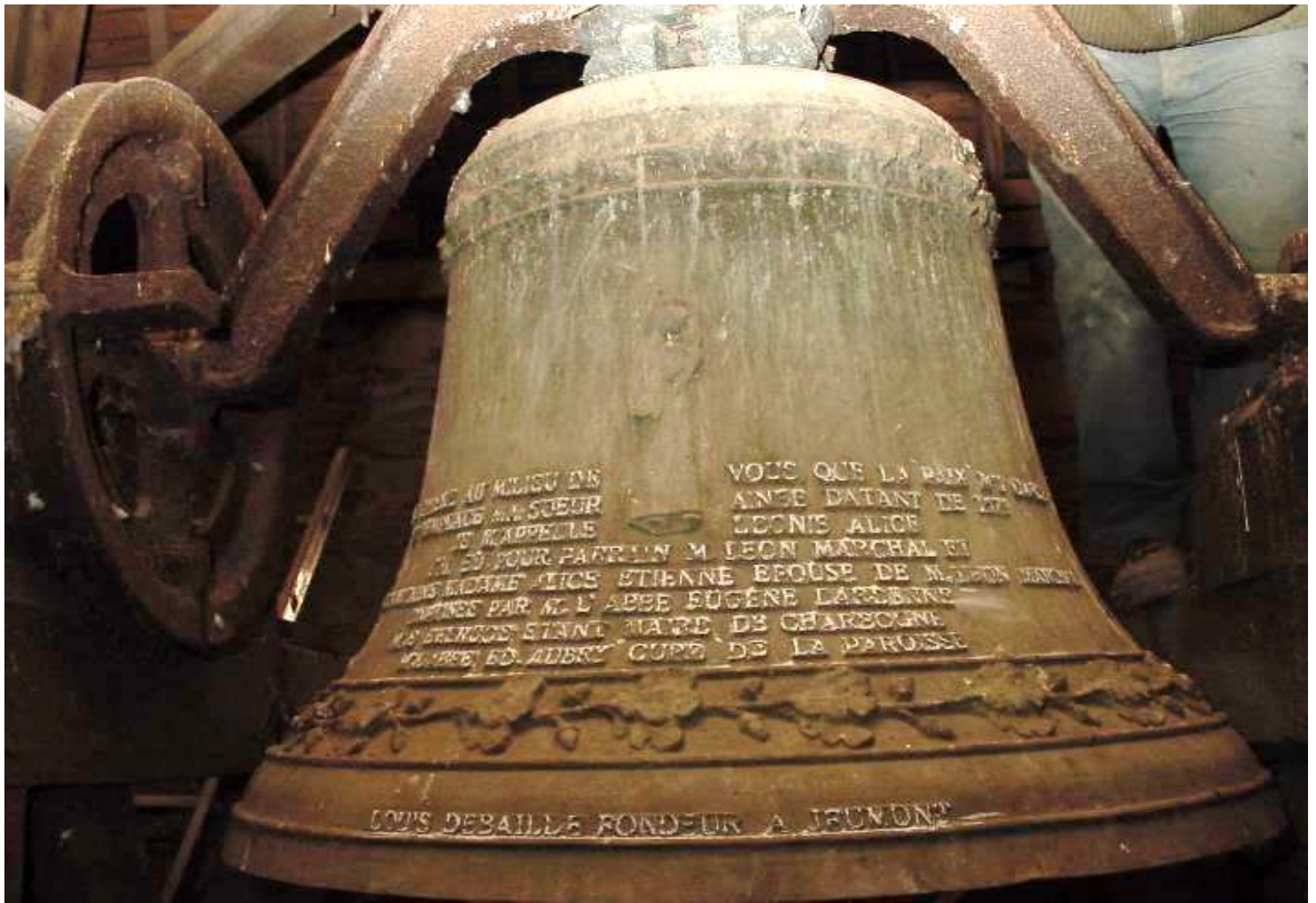
Cloche milieu - note SOL - 650 KG (ancienne 663 kg) 1m de diamètre base - 0,55m de diamètre haut - 0,85m + 0,18m de hauteur